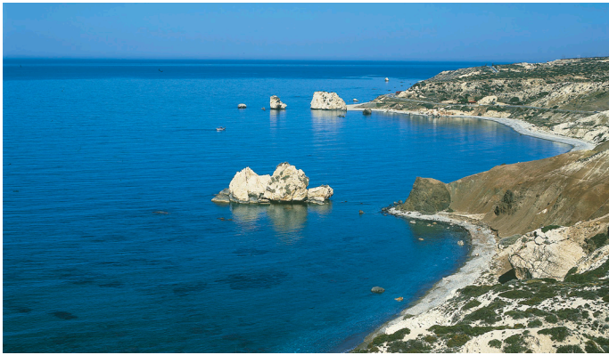
Felsen der Aphrodite

Ab Friedrichshafen beginnt Ihre Reise nach Paphos im Westen Zyperns. Nach der Ankunft werden Sie in Ihr Hotel in Paphos, der Europäischen Kulturhauptstadt des Jahres 2017, gebracht. Während der folgenden Tage haben Sie mit unserem Ausflugs-paket die Gelegenheit Zyperns schönste Seiten zu entdecken.