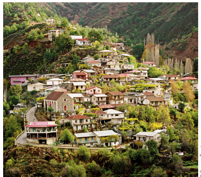
Ortschaft im Troodosgebirge